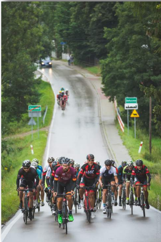
Wyścig w ramach III etapu Euroregion Tatry Tour.

Wystawa jest otwarta od poniedziałku do piątku w godzinach od 9:00 do 15:00 i będzie czynna do dnia 21 października 2017 roku.