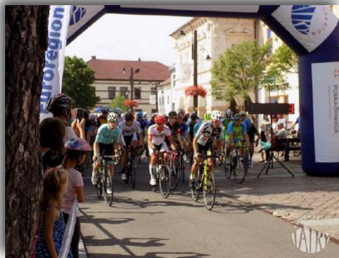
Start II etapu Euroregion Tatry Tour.

1 października 2017 roku w Ludźmierzu i będzie głównym wydarzeniem całego wyścigu oraz wyłoni ostatecznych zwycięzców we wszystkich klasyfikacjach. Dodatkowym działaniem w ramach tego zadania będzie konkurs wiedzy dla młodzieży szkolnej w zakresie atrakcji kulturowych i przyrodniczych na Szlaku wokół Tatr. Dla laureatów wyścigu oraz konkursu przewidziano nagrody.