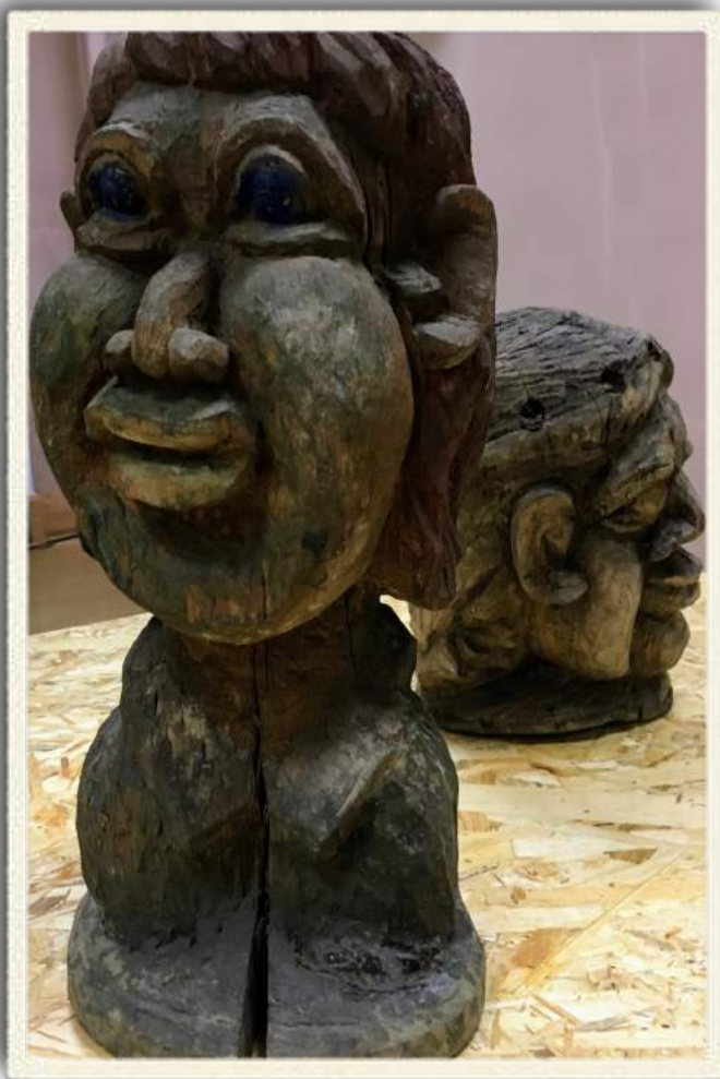
Rzeźby Edwarda Sutora na wystawie pt. "Szukający głowy".

października 2017 roku, niestety bez udziału autora, który zmarł w dniu 18 sierpnia 2017 roku. Książka opowiada o historii społeczno-gospodarczej południowych kresów Polski i portretuje zróżnicowane etnicznie i kulturowo społeczności. Dzieło to stanowi cenny wkład do badań i popularyzacji tematyki karpackiej.