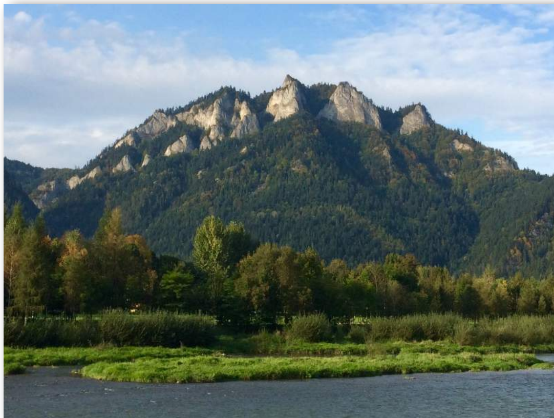
Widok na Trzy Korony w Pieninach Właściwych z "transgranicznej" kładki na rzece Dunajec - fot. Mateusz Skupień

we wrześniu 2017 roku Związek Euroregion „Tatry” zrealizował wiele zadań – odbyły się spotkania oraz szkolenia w ramach Programu Interreg V-A Polska-Słowacja 2014-2020. Szczególną uwagę poświęcono drugiemu naborowi wniosków o dofinansowanie mikroprojektów z Europejskiego Funduszu Rozwoju Regionalnego w ramach projektu parasolowego pt. „Łączy nas natura i kultura”, który trwał do 29 września bieżącego roku. W czasie naboru miały miejsce również konsultacje indywidualne, skierowane przede wszystkim do potencjalnych wnioskodawców. W ramach ogłoszonego II naboru złożono 42 wnioski po polskiej stronie, a po słowackiej 20 wniosków.